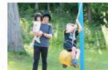
塩谷町総合公園 ちびっこ広場