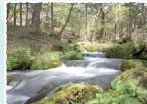
しょうじんざわゆうせい

マス、ワカサギ釣りやキャンプを楽しむため、週末は家族連れで賑わいをみせています。冬には湖の全面が凍結する幻想的な光景がみられ、写真家が多く訪れる美しい憩いのスポットです。