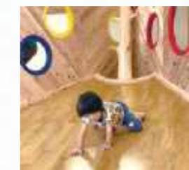
塩谷町子ども未来館 （しおらんど）